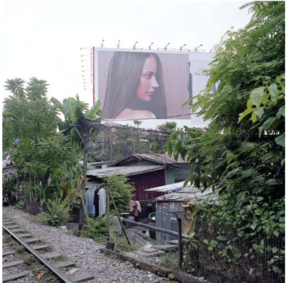
Bangkok 15/7/2007 Inkjet on Epson paper 100 x 100 cm Edition of 3