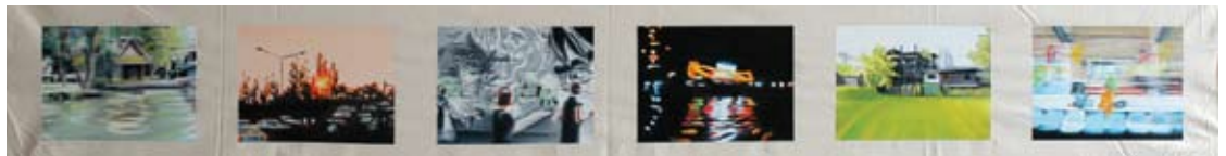
On the road 2010 Oil on canvas 38 x 180 cm