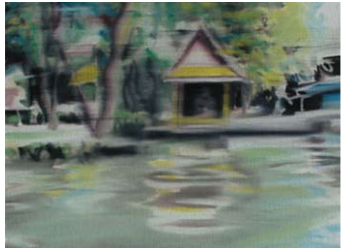
On the road (detail) 2010 Oil on canvas 16 x 23 cm