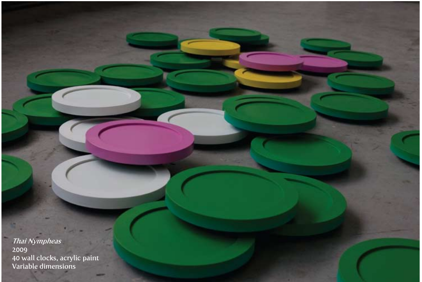
Thai Nymphs 2009 40 wall clocks, acrylic paint Variable dimensions